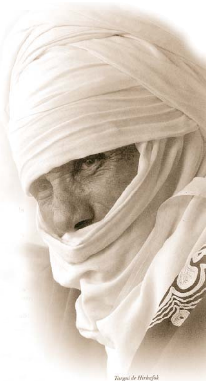
Targui de Hichafik