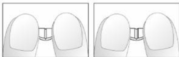
Schémas 3 et 4: Modalités d'obtention de 1/4 (quarts) de comprimés

Votre médecin peut décider d'associer d'autres médicaments à TEMERIT 5 mg pour vous traiter