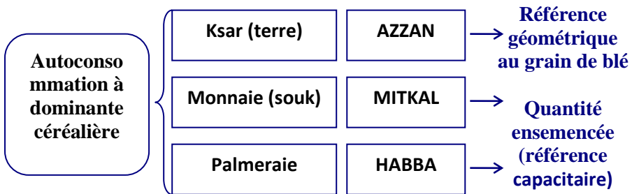
Figure.2 Schéma expliquant le référent commun (eau/ksar/palmeraie) xvi

Sur la base de l'étude faite par les chercheurs, deux hypothèses ont été fondée, on retient La première hypothèse qui est la plus plausible, compte tenu du résultat appréhendé de nos hypothèses d'études est celle du référent commun céréalier.