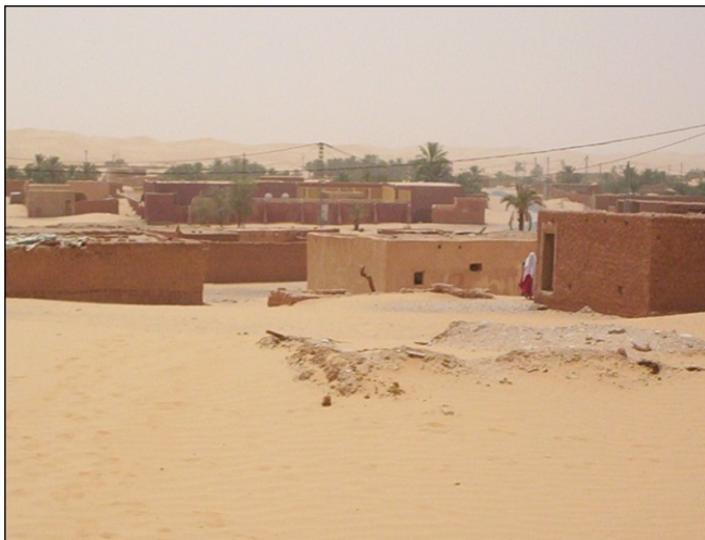
Figure 5 : Habitat dispersé, isolé et peu dense à Saguia dans la commune de Talmine