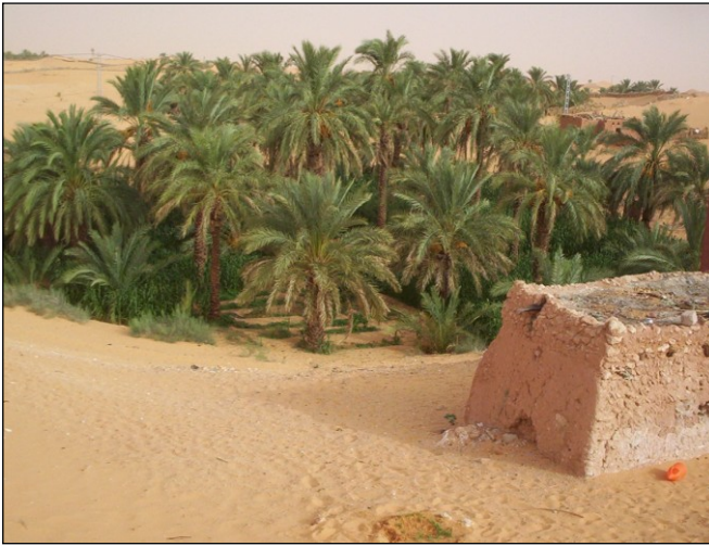
Figure 4 : Un exemple de Beurda dans le Taghouzi (Commune de Talmine)