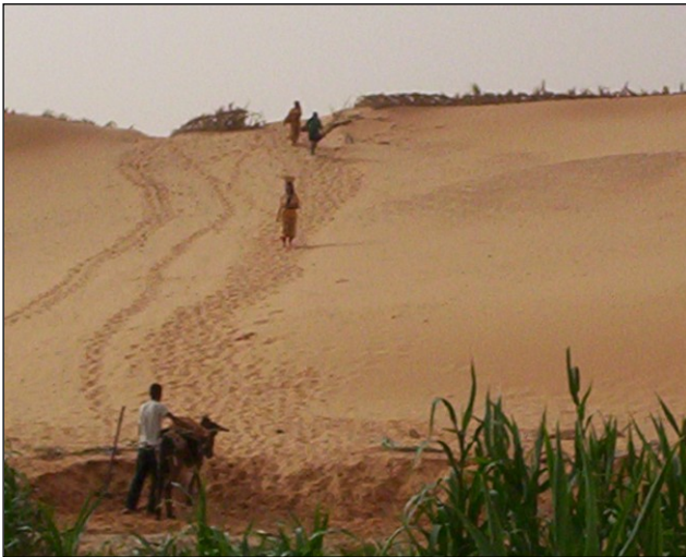
Figure 7 : L'évacuation des sables au-delà de la « Dune-Afreg » ; une tâche des enfants