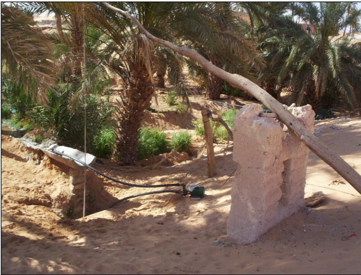
Figure 2 : Un puits à balancier, le Kerkaz, dans le Taghouzi (Commune de Talmine)