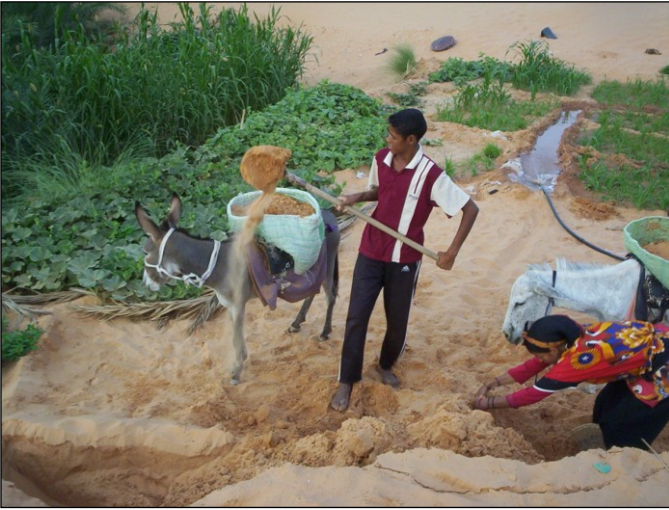
Figure 6 : Le désensablement : une tâche incontournable dans les jardins