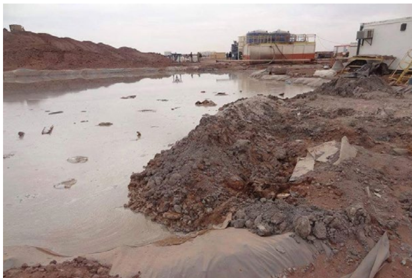
Il n'existe aucun système de traitement des eaux et des boues de forage.

Pour prouver la légitimité de leurs craintes, des citoyens pénètrent sur le site du forage situé à une trentaine de kilomètres d'In Salah le 3 février 2015 et prennent des photos et vidéos. Ils constatent l'absence de systèmes de traitement des eaux et des boues.