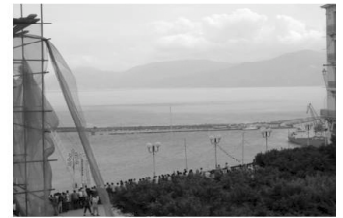
Vue sur le port et la baie depuis l'une des nombreuses terrasses de Béjaïa