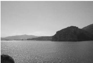
Derrière la pointe des Ayguades, Béjaïa...