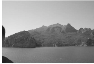
Les montagnes cachent Béjaïa, coincée entre les cuves à pétrole et le port, reliés par un pipeline qui la traverse