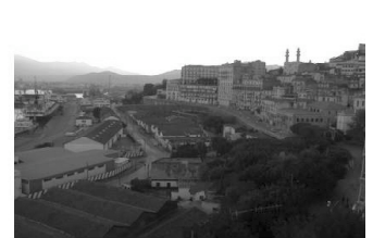
Le port de commerce et l'ancien centre ville