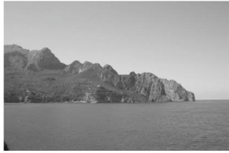
Le cap Carbon et le phare