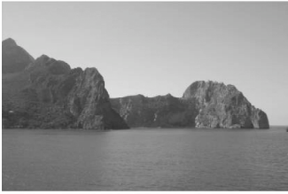
Le cap Carbon et le phare, lieux de promenade des Bougiottes (de gauche à droite)