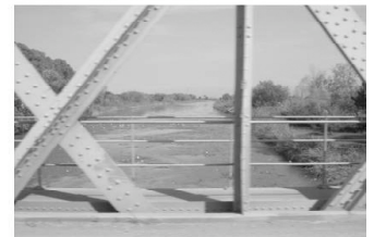
La Soummam à l'étiage