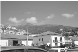
Yemma Gouraya depuis le port de voyageurs