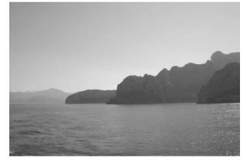
Paysage à l'approche de Bougie. Le cap Carbon ressemble à la tête d'un homme basculée