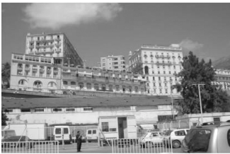
La place Gueydon depuis le port de voyageurs