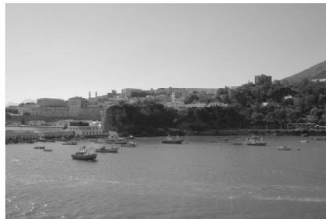
Le port de pêche de Bougie et la vieille ville