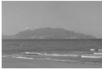
La presqu'île de Béjaïa depuis la plage de Tichi