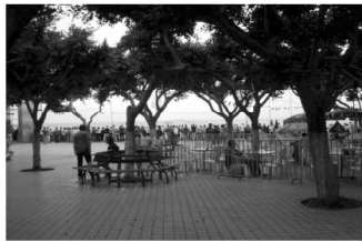
La place Gueydon en été