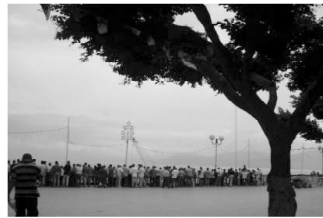
Un balcon en ville. Invitation aux voyages