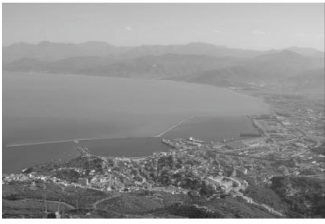
Le golfe de Béjaïa