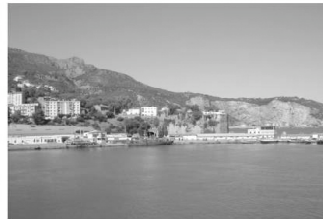
On est en mer et en ville ; c'est la montagne à la mer. Au fond : le port pétrolier