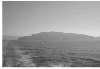
La presqu'île de Béjaïa depuis le ferry